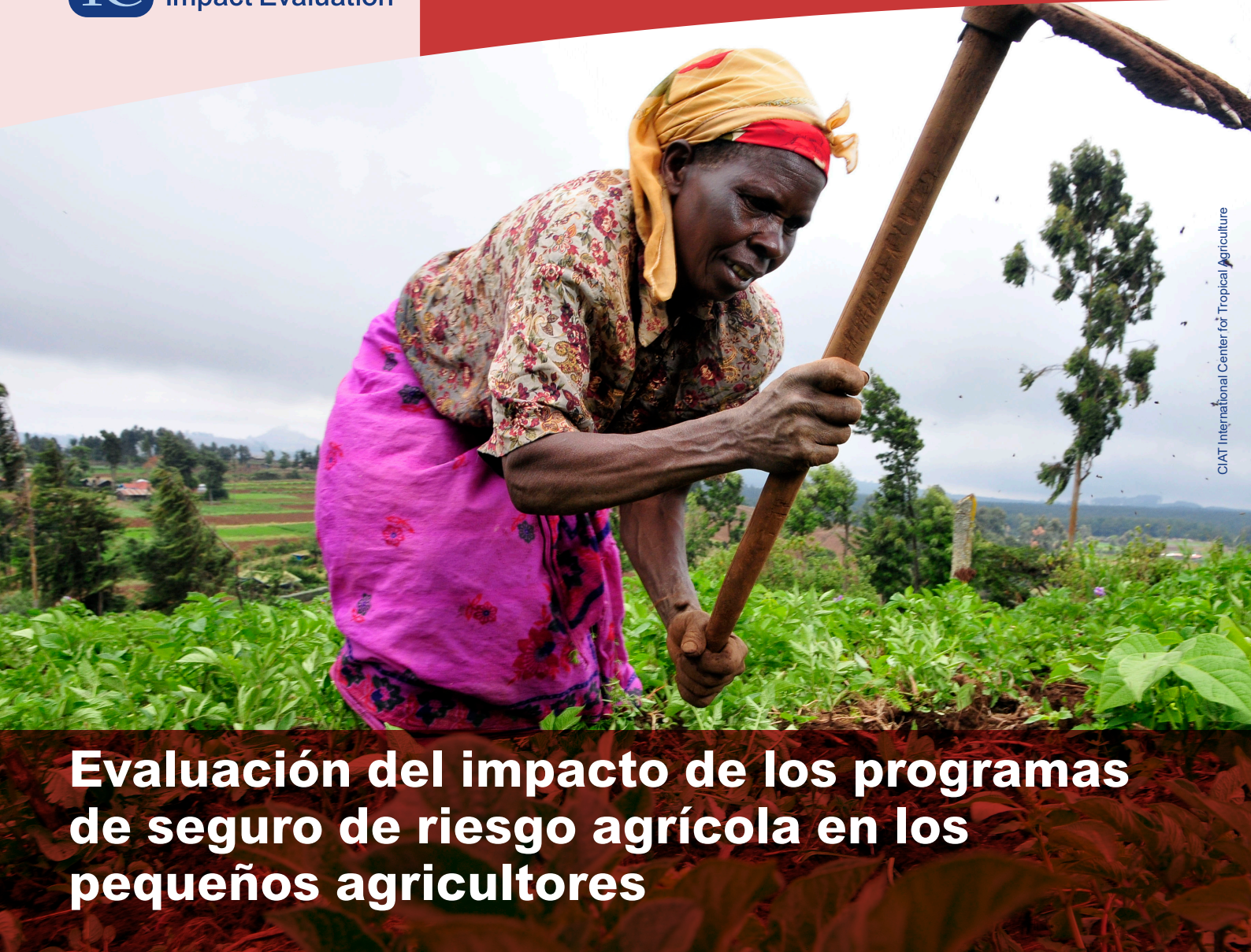
CIAT International Center for Tropical Agriculture